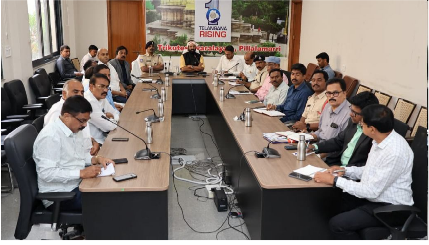
వేల మందికి కొత్త ఉద్యోగాలు కల్పించామని, తెలంగాణ సహకారంతో ఈ మేళా జరుగుతుందని తెలిపారు. హుజూర్ నగర్ లోని స్వర్ణ వేదిక ఫంక్షన్

పుత్రికా ప్రతినిధి, సూర్యాపేట, అక్టోబర్ 22: గ్రామీణ ప్రాంత నిరుద్యోగ యువతకు ఉద్యోగ, ఉపాధి అవకాశాలు కల్పించేందుకు ఈ నెల 25న హుజూర్ నగర్ లో మెగా జాబ్ మేళా నిర్వహించనున్నట్లు రాష్ట్ర నీటిపారుదల, పౌరసరఫరాల శాఖ మంత్రి నలమద ఉత్తమ్ కుమార్ రెడ్డి తెలిపారు. సూర్యాపేట సమీకృత జిల్లా అధికారుల కార్యాలయంలో ఉమ్మడి నల్గొండ జిల్లా ఇంజనీరింగ్, డిగ్రీ, పాలిటెక్నిక్, బదిలీ కళాశాలల ప్రిన్సిపల్స్, కరస్పాండెంట్లతో జరిగిన ముందస్తు సమావేశంలో మంత్రి మాట్లాడారు. ఆయన మాట్లాడుతూ గ్రామీణ ప్రాంతాల్లో ఆర్థికంగా వెనుకబడిన కుటుంబాలు పిల్లలను ఉన్నత విద్య చదివిస్తుండగా, అవగాహన రాహిత్యంతో ఉద్యోగ అవకాశాలను అందుకోలేకపోతున్నారని పేర్కొన్నారు. ఈ నేపథ్యంలో ఉమ్మడి నల్గొండ జిల్లాలోని నిరుద్యోగ యువతకు మంచి అవకాశాలు కల్పించాలన్న ఉద్దేశంతో జాబ్ మేళా నిర్వహిస్తున్నట్లు తెలిపారు. గత 20 నెలల్లో రాష్ట్రవ్యాప్తంగా 70 నుండి 75