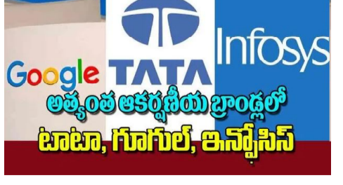
ఇన్ఫోసిస్ మూడో స్థానంలో ఉంది. ఈ జాబితాలో సామ్సంగ్ ఇండియా, జేపీ మోర్గాన్ చేజ్ 4, 5 స్థానాలను దక్కించుకోగా..

న్యూఢిల్లీ: దేశంలో ఉద్యోగులకు అత్యంత ఆకర్షణీయ కార్పొరేట్ బ్రాండ్లు జాబితాలో టాటా గ్రూప్, గూగుల్ ఇండియా, ఇన్ఫోసిస్ తొలి మూడు స్థానాల్లో నిలిచాయని 'రాండ్ స్ట్రాట్ ఎంప్లాయిర్ బ్రాండ్ రీసెర్చ్ (ఆర్కేబీఆర్) 2025' నివేదిక వెల్లడించింది. భారత్ లో ఉద్యోగులు వృత్తి-వ్యక్తిగత జీవిత సంతృప్తి, ఈక్విటీ, ఆకర్షణీయ వేతనం సహా అదనపు ప్రయోజనాలు వంటి ఎంప్లాయి వాల్యూ ప్రపాజిషన్స్ (ఈవీపీ)కు అధిక ప్రాధాన్యమిస్తున్నారని నివేదిక పేర్కొంది. ఆర్థిక సమృద్ధి, వృత్తిలో పురోగతి అవకాశాలు, పేరు ప్రతిష్టల విషయంలో టాటా గ్రూప్ నకు అధిక స్కోర్ లభించిందని, తద్వారా లిస్ట్ లో టాటా నిలిచిందని రాండ్ స్ట్రాట్ తెలిపింది. గత ఏడాదితో పోలిస్తే గూగుల్ ఇండియా తన ర్యాంకింగ్ ను మెరుగుపరుచుకుని రెండో స్థానానికి చేరుకోగా.. దేశీయ ఐటీ దిగ్గజం