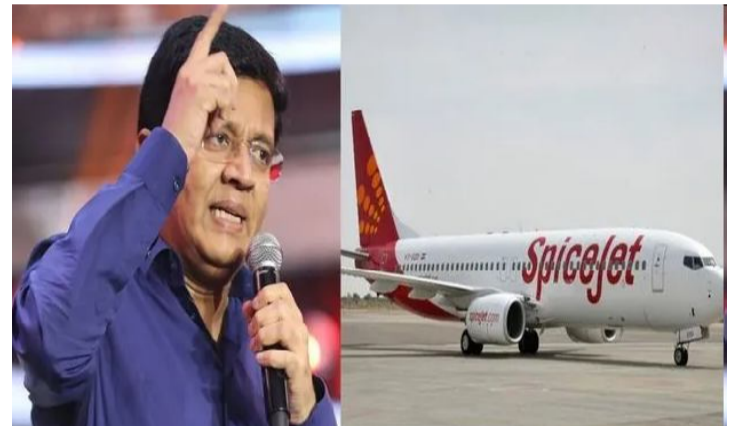
రూ.1300 కోట్ల నష్టపరిహారం క్లెయిమ్ ను తోసిపుచ్చింది. ఈ తీర్పు కేఎలె ఎయిర్వేస్ కు పెద్ద ఎదురుదెబ్బగా నిలిచింది. అయినప్పటికీ, మే 2024లో కళానిధి మారన్, కేఎలె ఎయిర్వేస్ మరోసారి సైన్ జెట్ దాని చైర్మన్ అజయ్ సింగ్ పై రూ.1,323 కోట్ల నష్టపరిహారం కోరుతూ కేసు వేశారు. అదనంగా, రూ.353.50 కోట్ల బకాయిలను కూడా వసూలు చేయాలని వారు కోరారు.

సుప్రీంకోర్టు జూలై 23, 2025న ఇచ్చిన తీర్పుతో కళానిధి మారన్ అధ్యక్షులలోని కేఎలె ఎయిర్వేస్ కు గట్టి ఎదురుదెబ్బ తగిలింది. సైన్ జెట్ ఎయిర్లైన్స్ పై రూ.1300 కోట్ల నష్టపరిహారం కోరుతూ కేఎలె ఎయిర్వేస్ దాఖలు చేసిన అప్పీల్ ను సుప్రీంకోర్టు కొట్టివేసింది. ఈ తీర్పు ఢిల్లీ హైకోర్టు గతంలో ఇచ్చిన ఆదేశాలను సమర్థించింది. ఢిల్లీ హైకోర్టు మే 23, 2024న కేఎలె ఎయిర్వేస్ క్లెయిమ్ ను పక్కా ప్రణాళికతో కూడిన జూరు అని, వాస్తవాలను ఉద్దేశపూర్వకంగా దాచడం జరిగిందని పేర్కొంటూ తిరస్కరించింది. కళానిధి మారన్, సైన్ జెట్ మధ్య 2015 నుంచి ప్రమాదాల వివాదం నడుస్తోంది. ఈ వివాదం సైన్ జెట్ లో మారన్ యాజమాన్య హక్కులు, షేర్ బదిలీ, ఆర్థిక లావాదేవీల చుట్టూ తిరుగుతోంది. ఆ క్రమంలోనే కేఎలె ఎయిర్వేస్, సైన్ జెట్ పై రూ.1300 కోట్ల నష్టపరిహారం కోరుతూ ఢిల్లీ హైకోర్టులో కేసు వేసింది. అయితే, ఈ క్లెయిమ్ ను హైకోర్టు తిరస్కరించడంతో, మారన్ సుప్రీంకోర్టును ఆశ్రయించారు. కానీ, సుప్రీంకోర్టు కూడా హైకోర్టు తీర్పును ధృవీకరించడంతో మారన్ కు మరోసారి నిరాశ ఎదురైంది. గతంలో, ఒక ఆర్బిటిల్ డ్రీబ్యూసల్ కూడా కేఎలె ఎయిర్వేస్