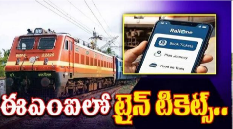
ఈఎంఐలో రైలు టికెట్లు.. చేతిలో దబ్బులుండవు. అర్జంటుగా ఊరికెళ్లాలి. ఎవరి దగ్గర చేబడులు తీసుకోవాలా అనే ఆలోచనలు మనసును ముంచెత్తుంటాయి. కానీ, ప్రయాణికులు అలా చింతించాల్సిన అవసరం లేకుండా ఇండియన్ రైల్వే క్యాటరింగ్ అండ్ టూరిజం కార్పొరేషన్ ఈఎంఐలో ట్రైన్ టికెట్

కొనుగోలు చేసే సదుపాయం ప్రవేశపెట్టింది మిక్ సాధారణ, తత్కాల్ టికెట్ బుకింగ్ కోసం ఈ సేవలను ఉపయోగించుకోవచ్చు. యావ్ వినియోగించే ప్రతి ఒక్కరూ ఎలాంటి దాక్యుమెంటేషన్ సమర్పించకుండానే ఈ సేవలు పొందవచ్చు. 6 లేదా 8 నెలల వ్యవధిలో ఇన్ స్టాల్ మెంట్లు చెల్లించే సౌకర్యాన్ని ఐఆర్సీటీసీ కల్పిస్తోంది. పూర్తి టికెట్ అమౌంట్ మాత్రమే కాకుండా టికెట్ బుకింగ్ సమయంలో కొంత మొత్తం చెల్లించి మిగిలినది ఈఎంఐగా మార్చుకునే వెసులుబాటు ఉంది. కాలవ్యవధి ఆధారంగా వడ్డీరేటు ఉంటుందని గుర్తుంచుకోవాలి.