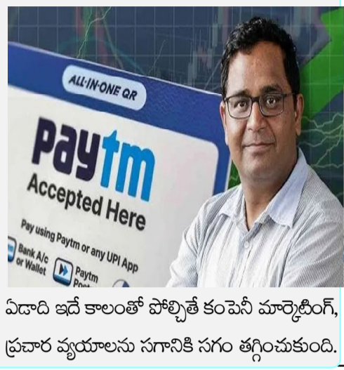
ఏడాది ఇదే కాలంతో పోల్చితే కంపెనీ మార్కెటింగ్, ప్రచార వ్యయాలను సగానికి సగం తగ్గించుకుంది.

న్యూఢిల్లీ: పేటీఎం బ్రాండ్ మాతృసంస్థ వన్97 కమ్యూనికేషన్స్ తొలిసారిగా లాభాల్లోకి అడుగు పెట్టింది. జూన్ తో ముగిసిన తొలి త్రైమాసికంలో రూ.122.50 కోట్ల కనాలిడేటెడ్ నికర లాభం ప్రకటించింది. వ్యయాలను గణనీయంగా నియంత్రించడంతో పాటు పేమెంట్ ఆదాయాలు పెరగడం ఇందుకు దోహదపడినట్లు కంపెనీ తెలిపింది. గత ఏడాది ఇదే కాలంలో కంపెనీ రూ.840 కోట్ల నికర నష్టం ప్రకటించింది. స్థూల లాభం సైతం రూ.72 కోట్లుగా నమోదైంది. గత