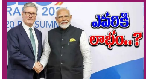
భారత్-యునైటెడ్ కింగ్డమ్ మధ్య స్వేచ్ఛా వాణిజ్య ఒప్పందం మరొకాన్ని గుంటల్లో పూర్తి కాబోతోంది. ప్రధాని మోదీ తన ఇంగ్లండ్ పర్యటనలో భాగంగా గురువారం నాడు ఈ ఒప్పందంపై సంతకం చేయబోతున్నారు.

చేయబోతున్నారు. ఇరు దేశాల మధ్య ఇది సమగ్ర ఆర్థిక, వాణిజ్య ఒప్పందంగా నిలవబోతోంది. 2030 నాటికి ఈ రెండు దేశాల మధ్య వాణిజ్యం 120 బిలియన్ డాలర్లకు పెంచాలని నిర్ణయించుకున్నారు. ఈ ఒప్పందం వల్ల ఇరు దేశాల్లో పలు రంగాలు లాభపడబోతున్నాయి యూకేలో ప్రస్తుతం వెయ్యికి పైగా భారతీయ కంపెనీలు కార్యకలాపాలను సాగిస్తున్నాయి. వీటిల్లో లక్ష మందికి పైగా పని చేస్తున్నారు. భారతీయ పారిశ్రామిక వేత్తలు యూకేలో