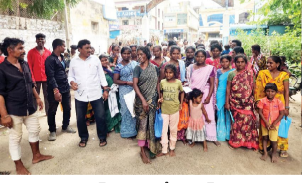
మాచర్ల సెప్టెంబర్ 25 (సందేశం టైమ్స్): తమకు ఇళ్ల స్థలాలు మంజూరు చేయాలని తహశీల్దార్ కార్యాలయం వద్ద స్థానిక తొమ్మిదో వార్డు ఎరుకల కాలనీ ప్రజలు ఆందోళన

చేపట్టారు. ఈ సందర్భంగా వారు మాట్లాడుతూ తామంతా నిరుపేదలమని, నంచార జీవితం గడుపుతూ పొట్టపోసుకుంటున్నామని చెప్పారు. కాలనీవారం ఇళ్ల స్థలాల కోసం దరఖాస్తు చేసుకోగా కొందరికి ఇళ్ల స్థలాలు మంజూరైనట్లు చెబుతున్నారని, అయితే ఎవరికి మంజూరయ్యాయో వివరాలు మాత్రం తెలియడం లేదని చెప్పారు. ఇప్పటికే చిన్నిచిన్న పాకల్లో ఉంటున్న తాము ఆ చిన్న ఇంటిలోనే రెండు మూడు కుటుంబాలు కాపురం ఉండాల్సి వస్తోందని, తమ ఆవేదనను గుర్తించాలని కోరారు. తహశీల్దార్ కిరణ్ కుమార్ స్పందిస్తూ విఆర్.ఓ.తో సర్వే చేయించి మంజూరైనవి కాకుండా, మిగిలిన అందరికీ స్థలాల్ని పంపిస్తామని హామీనిచ్చారు.