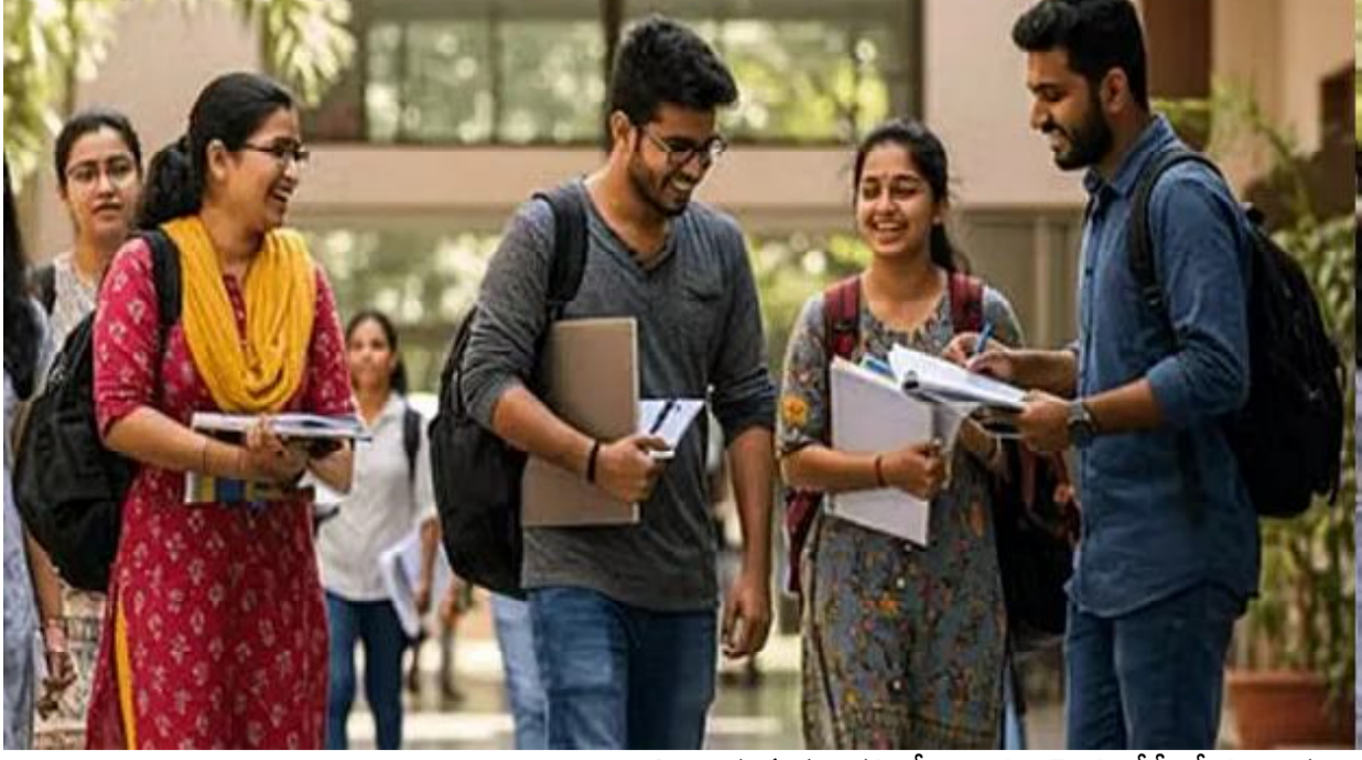
అమరావతి, సెప్టెంబర్ 25 (సందేశం టైమ్స్): రెండో విడత డిగ్రీ అడ్మిషన్లకు ఉన్నత విద్యామండలి బుధవారం షెడ్యూలులు జారీచేసింది. ఈ నెల 26 నుంచి 29 వరకు విద్యార్థులు రిజిస్ట్రేషన్ చేసుకోవచ్చని, 27 నుంచి 29 వరకు నర్సింగ్ కెట్ల వరతీలన జరుగుతుందని, 29 నుంచి 1 వరకు వెబ్ ఆప్షన్లు ఎంపిక చేసుకోవచ్చని తెలిపింది. 3న ఆప్షన్లు మార్చుకోవచ్చని, 6న నీట్లు కేటాయింపు

జరుగుతుందని పేర్కొంది. 7, 8 తేదీల్లో విద్యార్థులు కాలేజీల్లో రిపోర్టు చేయాలని సూచించింది. కాగా, తొలి విడతలో 1,30,265 మందికి నీట్లు కేటాయించారు. వారిలో 1,22,955 మంది విద్యార్థులు కాలేజీల్లో రిపోర్టు చేశారు. ఇంకా 7,310 మంది రిపోర్టు చేయాల్సి ఉంది. వారిలో సర్టిఫికేట్లు అప్లోడ్ చేయనివారు ఇప్పుడు అప్లోడ్ చేస్తే వారికి రెండో విడతలో నీట్లు కేటాయిస్తామని ఉన్నత విద్యామండలి తెలిపింది.