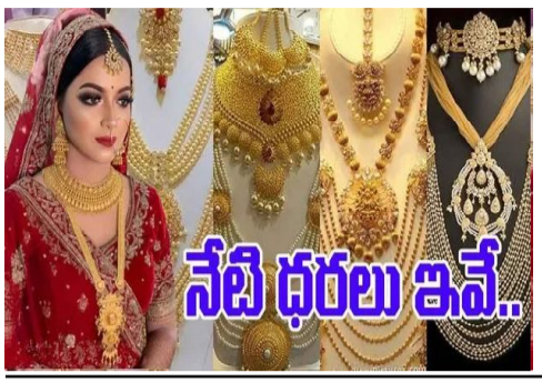
నేటి ధరలు ఇవే..

ఇంటర్నెట్ డెస్క్: భారత్లో బంగారం, వెండి ధరలు ఇదే స్థాయిలో తగ్గి రూ. 92,090కు చేరుకుంది. మరోసారి స్వల్పంగా తగ్గాయి. గుడ్ రిటర్న్స్ ఇక వెండి ధర నిన్నటితో పోలిస్తే రూ.100 మేర తగ్గింది. ప్రస్తుతం కిలో వెండి ధర రూ. 1,17,000గా ఉంది. ఇక 10 గ్రాముల ప్లాటినం ధర కూడా స్వల్పంగా తగ్గి రూ.38,880కు చేరుకుంది. ఇక 10 గ్రాముల 22 క్యారెట్ బంగారం ధర స్వల్పంగా తగ్గి రూ.1,00,470కు చేరుకుంది. ఇక 10 గ్రాముల 22 క్యారెట్ బంగారం కూడా చేరుకుంది.