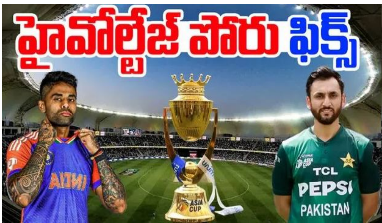
హెడ్ టూ హెడ్ ఈ టోర్నమెంట్లో భారత్, పాకిస్తాన్ ఇప్పటికే రెండుసార్లు తలపడ్డాయి. సెప్టెంబర్ 14న గ్రూప్ స్టేజీలో జరిగిన మ్యాచ్లో

ఆసియా కప్ 2025 ఫైనల్ మ్యాచ్ రణరంగం సిద్ధమైంది. శతాబ్దాల శత్రుత్వం, ఉద్వేగం, ఉత్సాహంతో కూడిన ఈ పోరులో భారత్, పాకిస్తాన్ జట్లు మునుపెన్నడూ లేనంత ఉత్సాహంతో తలపడనున్నాయి. ఈ రెండు జట్లు కూడా ఇప్పుడు టైటిల్ కోసం పోటీపడుతున్నాయి. ఈ టోర్నమెంట్లో మొదటిసారిగా ఈ రెండు దిగజ జట్లు ఫైనల్లో ఆడటం క్రికెట్ ప్రపంచాన్ని ఉర్రూతలూగిస్తోంది. ఈ పోరు కోసం ప్రపంచవ్యాప్తంగా ఉన్న అభిమానులు ఊపిరి బిగబట్టి ఎదురుచూస్తున్నారు. దుబాయ్ ఇంటర్నేషనల్ స్టేడియం ఈ ఉత్సాహకరమైన మ్యాచ్ సెప్టెంబర్ 28, 2025న (ఆదివారం) దుబాయ్ ఇంటర్నేషనల్ స్టేడియంలో రాత్రి 8 గంటలకు మొదలవుతుంది. దుబాయ్ స్పోర్ట్స్ సిటీలో ఉన్న ఈ స్టేడియం 25,000 సీటింగ్ కెపాసిటీ కలిగి ఉంది. అవసరమైతే 30,000 వరకు విస్తరించవచ్చు. 2009లో ప్రారంభమైన ఈ మైదానం రింగ్ ఆఫ్ ఫైర్ లైటింగ్, గుండ్రని పైకప్పుతో ప్రసిద్ధి చెందింది. ఇక్కడ గతంలో టీ20 వరల్డ్ కప్, ఐపీఎల్, ఆసియా కప్, %గ్రూప్ వంటి ప్రముఖ టోర్నమెంట్లు జరిగాయి.