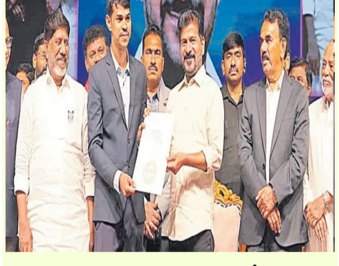
రక్షణ కల్పిస్తాం.. లాభాలు తెప్పించే బాధ్యత తీసుకుంటాం.. ప్రభుత్వాలే మారాయి.. విధానాలు కాదు: రేవంత్

హైదరాబాద్, సెప్టెంబరు 27 (సందేశం టైమ్స్): తెలంగాణ రాష్ట్రం పర్యాటకానికి గమ్యస్థానంగా ఉందని ముఖ్యమంత్రి రేవంత్ రెడ్డి అన్నారు. రాష్ట్రంలో, హైదరాబాద్ లో అనేక పర్యాటక కేంద్రాలు, పురాతన, వారసత్వ కట్టడాలు, ఆలయాలు ఉన్నాయని తెలిపారు. పర్యాటకరంగం పెట్టుబడిదారులు తెలంగాణలో పెట్టుబడులు పెట్టాలని పిలుపునిచ్చారు. ఆ పెట్టుబడులకు తమ ప్రభుత్వం భద్రత కల్పిస్తుందని, లాభాలు తెప్పించే బాధ్యత కూడా తీసుకుంటుందని భరోసా ఇచ్చారు. శనివారం ప్రపంచ పర్యాటక దినోత్సవాన్ని పురస్కరించుకుని రాష్ట్ర పర్యాటక శాఖ శిల్పారామంలోని సంప్రదాయ వేదికలో నిర్వహించిన 'పర్యాటక సదస్సు'కు సీఎం రేవంత్ రెడ్డి ముఖ్యఅతిథిగా హాజరై మాట్లాడారు. గతంలో రాష్ట్రంలో పర్యాటకరంగ విధానమంటూ లేదని, తాము అధికారంలోకి వచ్చిన తర్వాత పర్యాటక విధానాన్ని తీసుకొచ్చామని తెలిపారు.