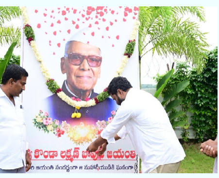
సందేశం టైమ్స్ సంగారెడ్డి టౌన్ (సెప్టెంబర్ 27) కొండా లక్ష్మణ్ బాపూజీ గారి జయంతి