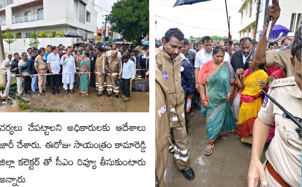
చర్యలు చేపట్టాలని అధికారులకు ఆదేశాలు జారీ చేశారు. ఈరోజు సాయంత్రం కామారెడ్డి జిల్లా కలెక్టర్ తో సీఎం రివ్యూ తీసుకుంటారు అన్నారు