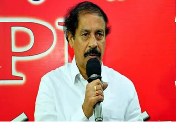
అమరావతి, జూలై 29 (సందేశం టైమ్స్) : వామపక్షాలు, ప్రజాసంఘాల ఐక్యవేదిక ఆధ్వర్యంలో వచ్చేనెల 5న అన్ని