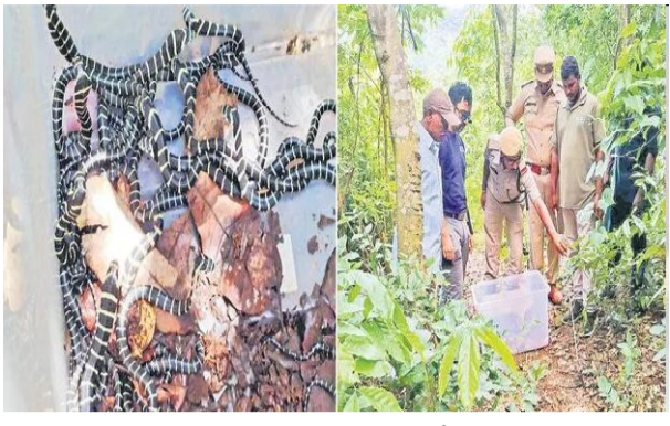
జూలై 29 (సందేశం టైమ్స్) : అల్లూరి సీతారామరాజు జిల్లా అసంతగిరి మండలం జీనబాడు రెవెన్యూ పరిధిలోని శంకరం