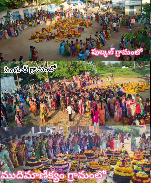
సందేశం టైమ్స్: పుల్కల్ మండలం ప్రతినిధి 29 సెప్టెంబర్ సంగారెడ్డి జిల్లా తెలంగాణ రాష్ట్రంలో బతుకమ్మ పండుగ చాలా పెద్దది అయినప్పటికీ పాఠకుల నిర్లక్ష్యం వల్ల అట్టి బతుకమ్మ

బతుకమ్మ వేడుకలకు అన్ని ఏర్పాట్లు చేసిన ఆయా గ్రామాల నాయకులు