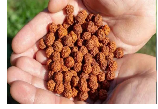
స్విస్ ప్రాంకులకు (దాదాపు రూ.4,659) విక్రయిస్తున్నాయి.

న్యూఢిల్లీ: భారతీయ ఆధ్యాత్మికతకు ప్రతీక అయిన రుద్రాక్షలు ఇప్పుడు అంతర్జాతీయ వెల్ నెట్ మార్కెట్ లో కీలక స్థానం ఏర్పడింది. ప్రధానంగా స్విట్జర్లాండ్ లో భారతీయ ప్రవాసులే కాకుండా, స్థానిక ప్రజలు కూడా రుద్రాక్షల కోసం విపరీత మైన ఆసక్తి కనబరుస్తున్నారు. ఇదిభారత ఎగుమతిదారులకు అద్భుతమైన అవకాశమని అధికారులు చెబుతున్నారు. వచ్చే నెల 1 నుంచి అమలులోకి రానున్న ఇండియా-ఈఎఫ్ డీపీ వాణిజ్య, ఆర్థిక భాగస్వామ్య ఒప్పందం (టీఈడీపీ).. ఇందుకు ప్రధాన దోహదకారి కానుందని అధికారులంటున్నారు. 2024-25లో భారత్ రూ.0.97 కోట్ల విలువైన రుద్రాక్షను ఎగుమతి చేసింది. ప్రవాస భారతీయులే కాకుండా స్థానిక స్విస్ ప్రజల్లో వెల్ నెట్, యోగాపై పెరుగుతున్న ఆసక్తిని ఆసరా చేసుకుని జ్యూరిచ్ లోని యోగా ఆన్ లైన్ స్టోర్లు, వెల్ నెట్ దుకాణాలు శరీరాన్ని చల్లబరిచే శక్తి కలిగిన ఉత్పత్తులుగా రుద్రాక్షకు ప్రచారం కల్పిస్తున్నాయి. ఒక్కో మాలను 50