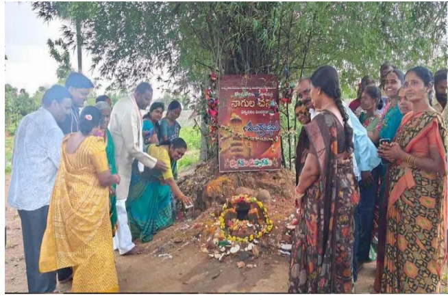
సుల్తానాబాద్ రూరల్, జూలై 30 (సందేశం టైమ్స్): గౌడ కులస్తుల ఆరాధ్య దైవమైన రేణుక ఎల్లమ్మ తల్లి ఆలయంలో నాగుల పంచమిని పురస్కరించుకొని ఓడి బియ్యంతో అన్న ప్రసాద వితరణ